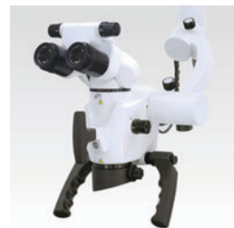
歯科用マイクロスコープ フライトビジョン